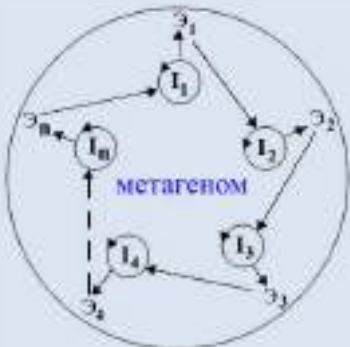
Рис.3. Модель гиперцикла с последовательной передачей эстафет I_i – индивиды, входящие в сообщество ( i = 1, 2, \dots, n ); \mathcal{E}_i – эстафеты ( i = 1, 2, \dots, n ). Среда, в которой происходит информационное взаимодействие, – метагеном.

Модель гиперцикла с последовательной передачей эстафет можно представить следующим образом: